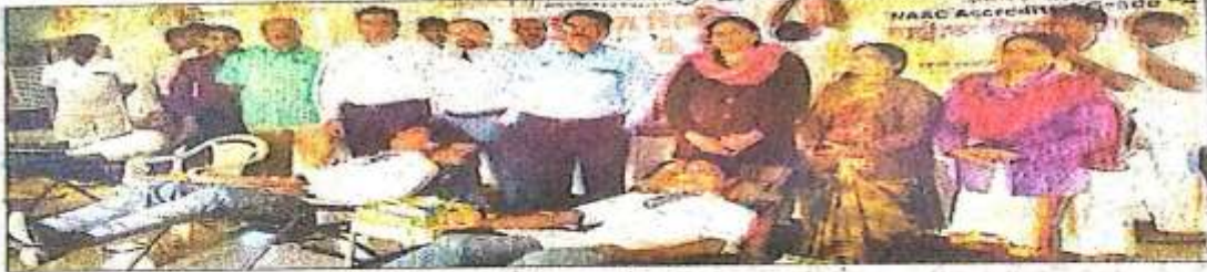
Dignitaries present in blood donation camp.